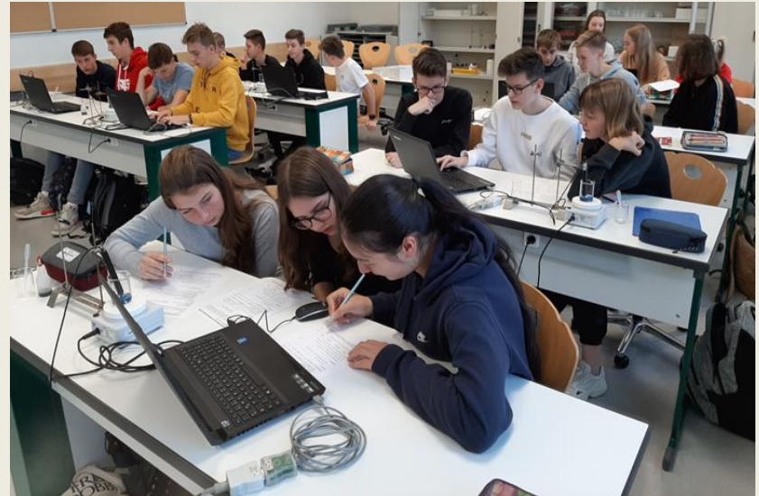
Messwerterfassung mit PC im Profilkurs Messen, Steuern Regeln