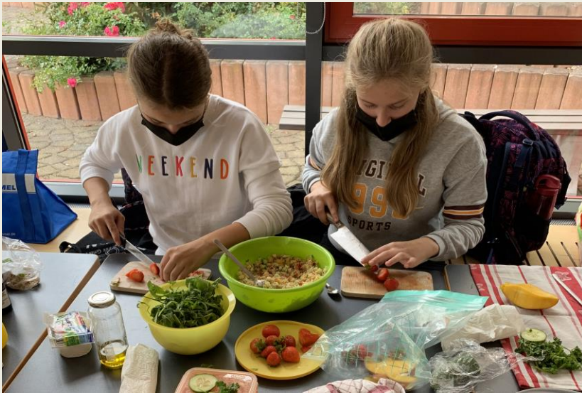
Ernährungslehre im Profilkurs Gesundheit

Im Rahmen des Kurses Messen, Steuern und Regeln erlernen unserer Schülerinnen und Schüler die Arbeit mit unserer Messelektronik und einer Auswertungssoftware, die dann in allen naturwissenschaftlichen Fächern einheitlich verwendet wird.