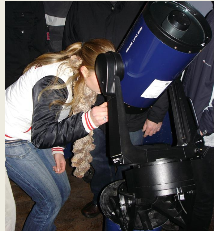
Himmelsbeobachtungen mit unserem Teleskop im Profilkurs Astronomie

Außerdem bietet unser Profil eine zusätzliche Vorbereitung auf Berufe in Technik, Naturwissenschaften und Medizin und die Biologie-, Chemie- und Physikkurse in der Abiturstufe.