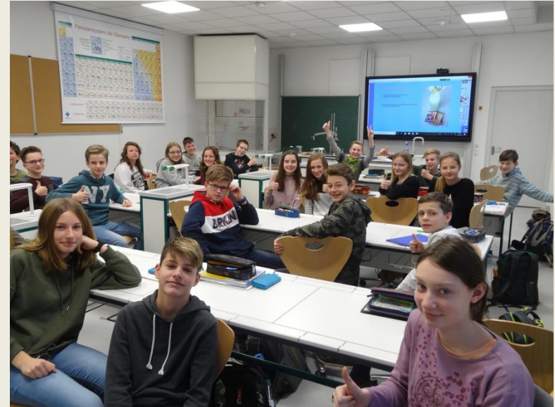
Moderne Unterrichtsräume stehen zur Verfügung

Der Profilunterricht findet von Klasse 8 bis 10 statt. Pro Schuljahr durchlaufen die Gruppen vier Profilkurse, in denen sich die Schülerinnen und Schüler ein umfangreiches und vielfältiges Wissen aneignen können. Folgende Themen werden unterrichtet.