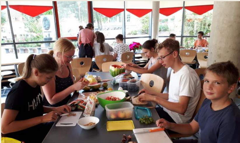
Ernährungslehre im Profilkurs Gesundheit

Im Rahmen des Kurses Messen, Steuern und Regeln erlernen unserer Schülerinnen und Schüler die Arbeit mit unserer Messelektronik und einer Auswertungssoftware, die dann in allen naturwissenschaftlichen Fächern einheitlich verwendet wird.