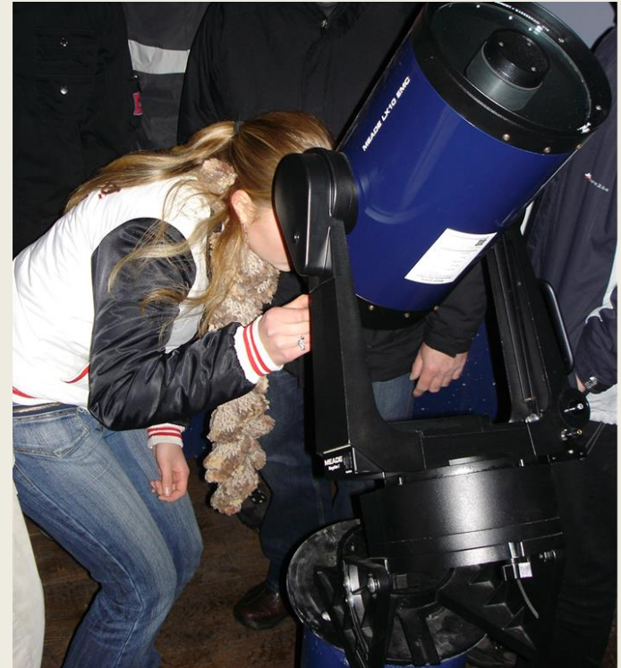
Himmelsbeobachtungen mit unserem Teleskop im Profilkurs Astronomie

Außerdem bietet unser Profil eine zusätzliche Vorbereitung auf Berufe in Technik, Naturwissenschaften und Medizin und die Biologie-, Chemie- und Physikkurse in der Abiturstufe.