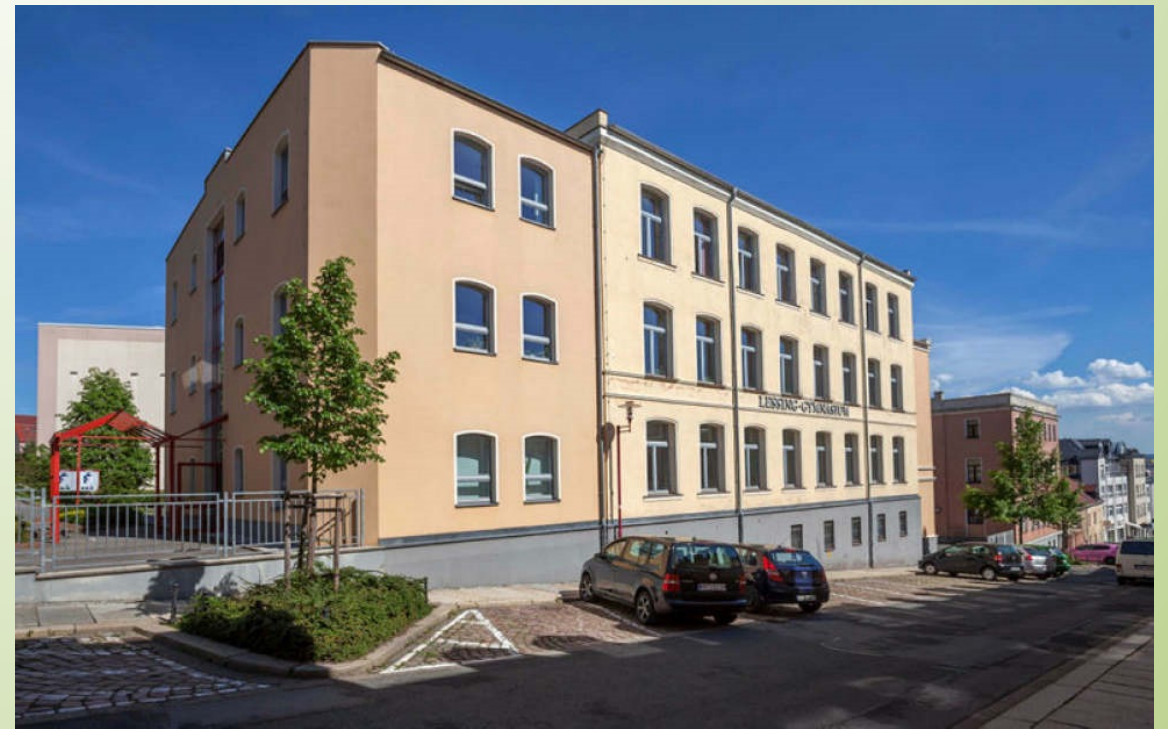
Haus der Naturwissenschaften 12 moderne Fachkabinette für Chemie, Biologie, Physik