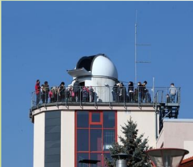
Observatorium auf dem Hauptgebäude