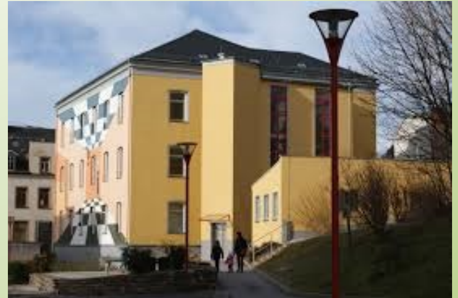
Haus der Kunst und der Gesellschaftswissenschaften