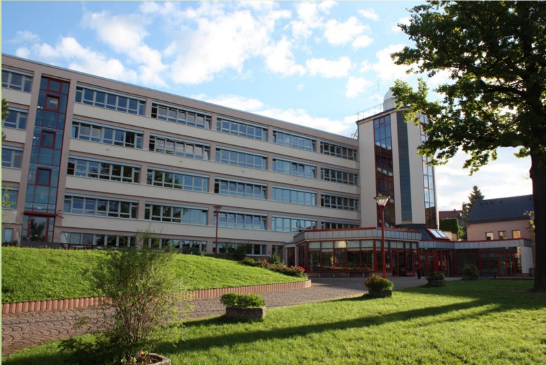
Hauptgebäude mit Aula, Cafeteria, und Bibliothek